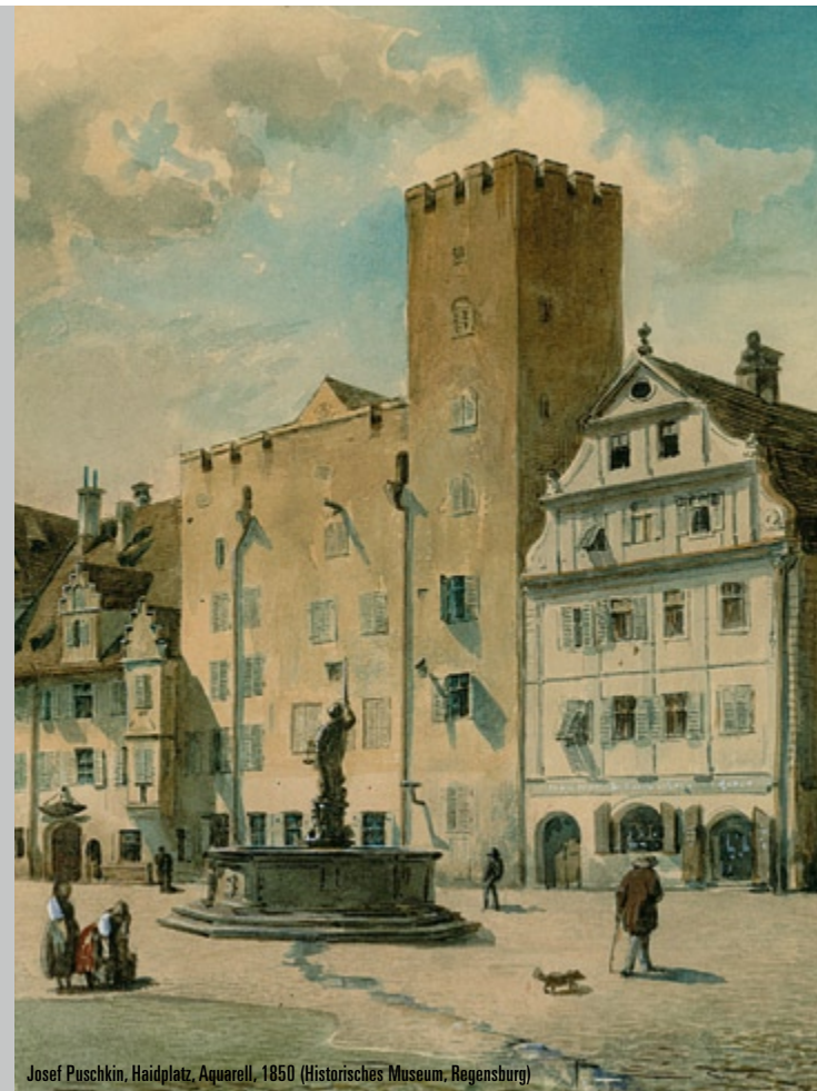
Josef Puschkin, Haidplatz, Aquarell, 1850 (Historisches Museum, Regensburg)